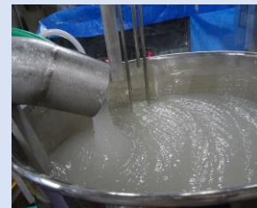
こんにゃく造っています。